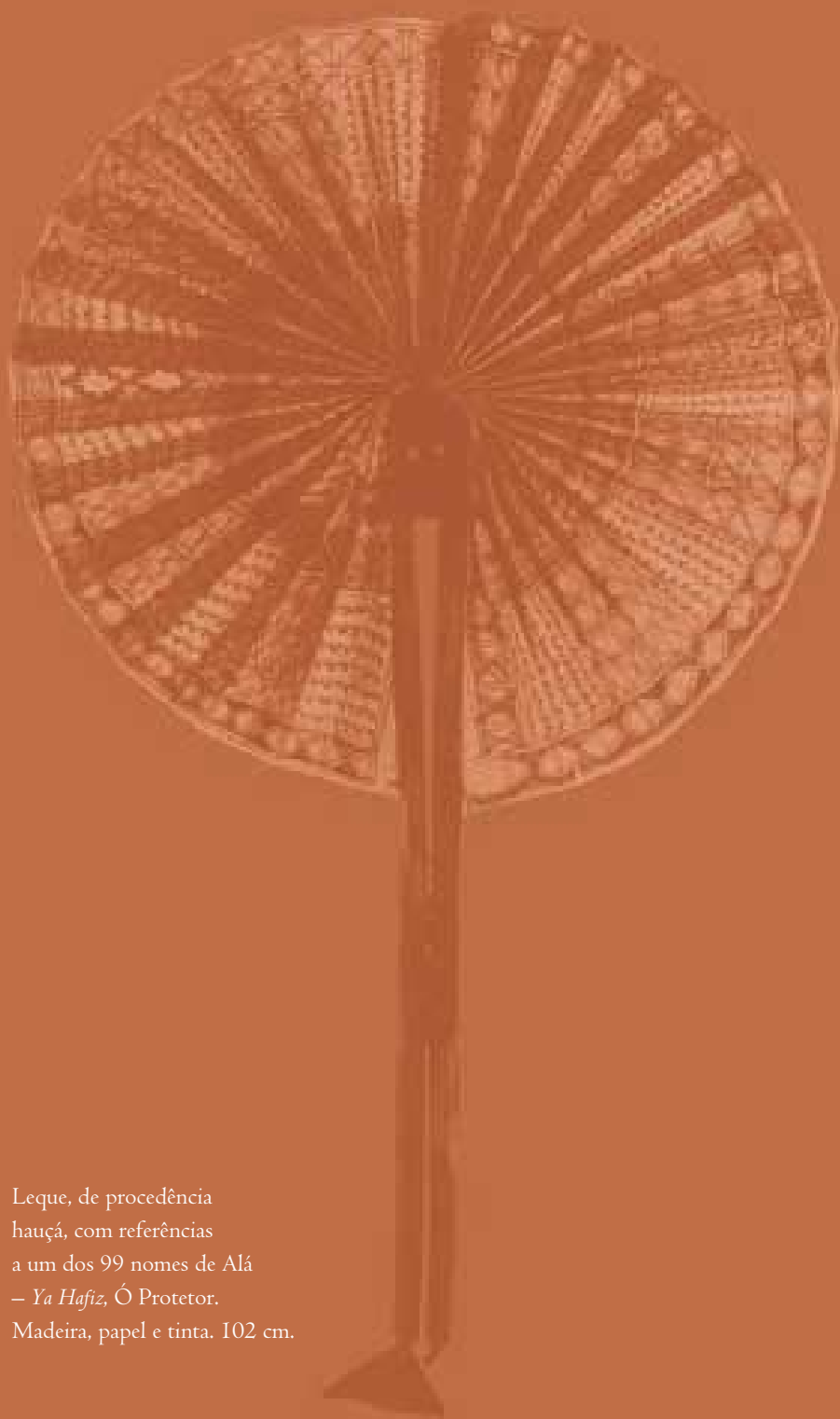
Leque, de procedência hauçá, com referências a um dos 99 nomes de Alá – Ya Hafiz , Ó Protetor. Madeira, papel e tinta. 102 cm.