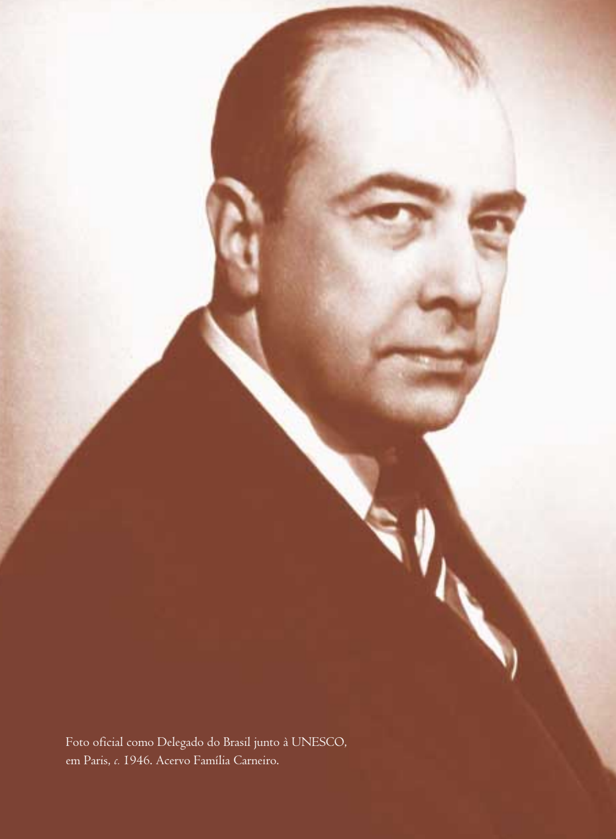
Foto oficial como Delegado do Brasil junto à UNESCO, em Paris, c. 1946.